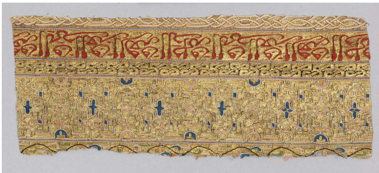
Figura 5. Fragmento de la dalmática de San Valero, siglo XIII, Metropolitan Museum of Art, Nueva York. Fotografía: Metropolitan Museum of Art, Nueva York ( https://www.metmuseum.org/art/collection/search/450727 ).

excelentes muestras en la colección procedente de los sepulcros del monasterio de Santa María la Real de Huelgas, lo que evidencia que se imitaron en los telares andalusíes, como las ropas de doña Berenguela, el pellote de Leonor de Castilla, la cofia del infante Fernando de Castilla, el forro del ataúd de Fernando de la Cerda, la almohada de Leonor de Castilla, la almohada de María de Almenar [9, pp. 28-29, 48-49, 54-55, 60-61, 91-101], así como en otros tejidos coetáneos como el sudario de doña Mencía de Lara (monasterio de San Andrés del Arroyo, Palencia) y la dalmática de don Rodrigo Ximénez de Rada (monasterio de Santa María de Huerta, Soria) [22, pp. 234-235, 194-197]. La decoración de la almohada de Leonor de Castilla, la cofia del infante don Fernando o una de las bandas de la dalmática de San Valero con fragmentos varios museos, entre otros Metropolitan Museum of Art de Nueva York (Figura 5) o Cleveland Museum of Art (inv. 1928.650) [6, pp. 192-193], formada por cintas que se entrelazan formando estrellas y motivos geométricos, está en relación con la que orna las calzas y el alba del rey de Sicilia Guillermo II (Kunsthistorisches Museum, Viena), con una cronología similar en el segunda mitad del siglo XII o comienzos del siglo XIII [24, pp. 80-83, figs. 1-2], esquemas decorativos que comparten con trabajos en otros materiales, como el minbar de la mezquita Kutubiya de Marrakech (Museo del palacio Badi, Marrakech), en este caso un trabajo cordobés.