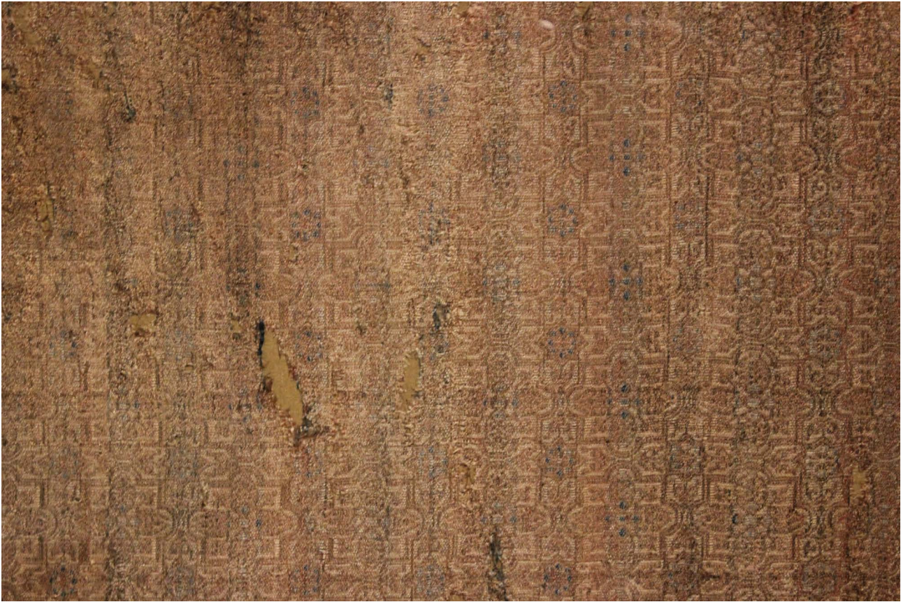
Figura 10. Fragmento de la capa del infante D. Felipe, ca. 1274, Museo Arqueológico Nacional, Madrid.