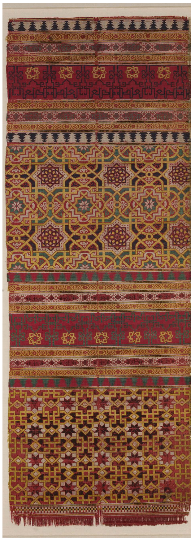
Figura 8. Fragmento de tejido, siglo XIV, Metropolitan Museum of Art, Nueva York.