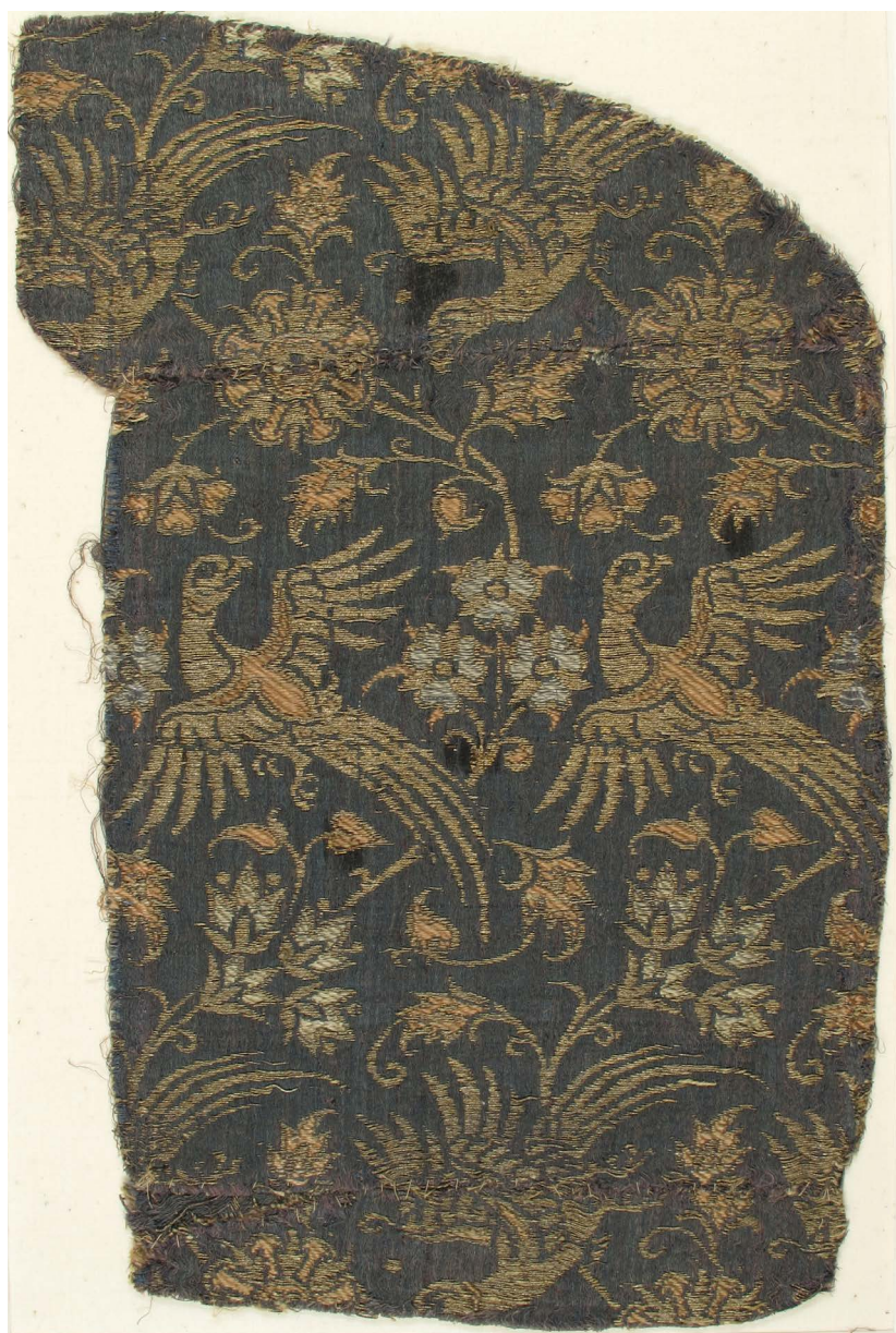
Figura 3. Fragmento de tejido, Lucca, siglo XIV, Metropolitan Museum of Art, Nueva York.