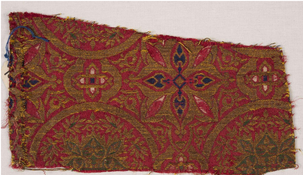
Figura 6. Fragmento de tejido, siglo XIV, Museo Lázaro Galdiano, Madrid.

leyendas epigráficas mensajes legitimadores por parte de un reino en claro declive habida cuenta del uso que de esos tejidos se hacía entre las clases poderosas del reino de Castilla, del que era vasallo. Esta composición ondulante poco difiere de piezas manufacturadas en la otra orilla del Mediterráneo, como un damasco egipcio del Museo del Hermitage de San Petersburgo (inv. EG-905) [6, p. 259, fig. 7.16]. El vínculo entre manufacturas coetáneas dificulta la clasificación de algunos tejidos como andalusíes o de Oriente Próximo, como un fragmento de Abegg-Stiftung en Riggisberg (inv. 3158) decorado con palmetas en ritmo vertical ondulante [28, p. 225, cat. 129], lo que pone de manifiesto la adecuación de los talleres ibéricos a las corrientes decorativas de origen oriental.