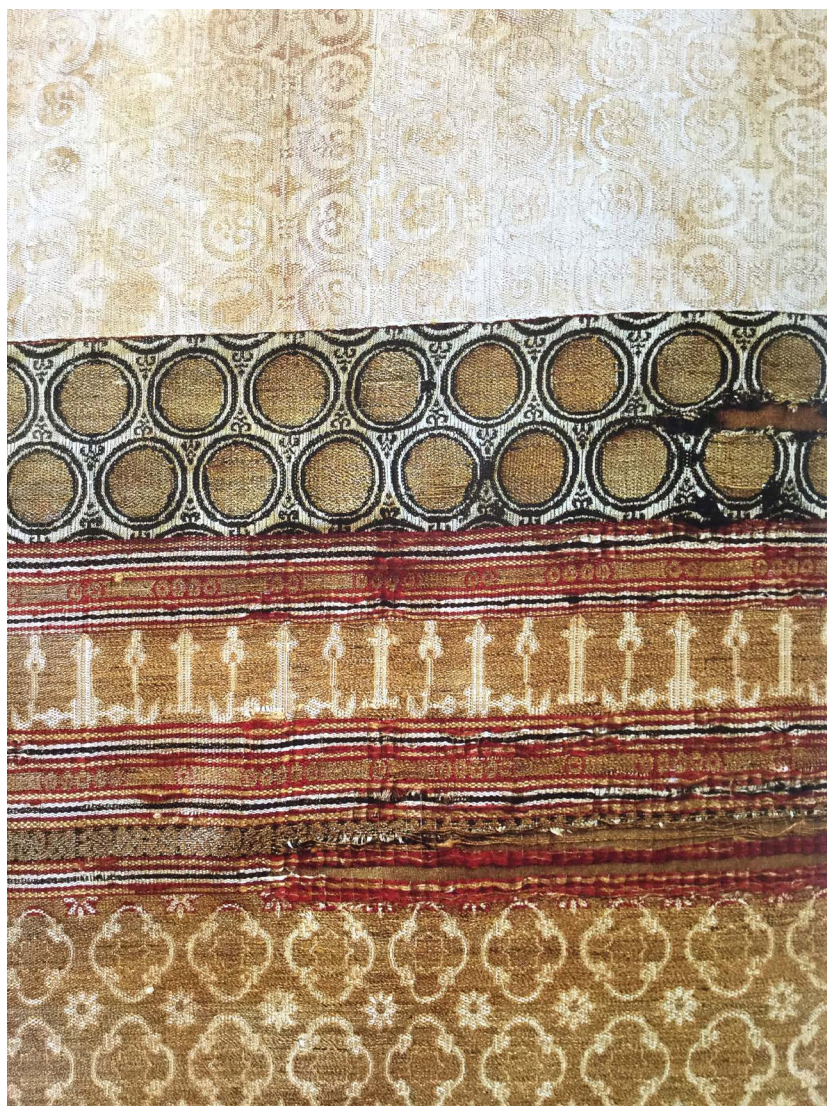
Figura 4. Detalle de la dalmática de Rodrigo Ximénez de Rada, ca. 1274, Monasterio de Santa María de Huerta, Soria.

En las manufacturas del oriente musulmán se ponen de moda las telas a rayas o raqm [23, p. 80] formadas por franjas de distinta anchura y color y que pueden contener motivos variados. De estos tejidos a rayas hay