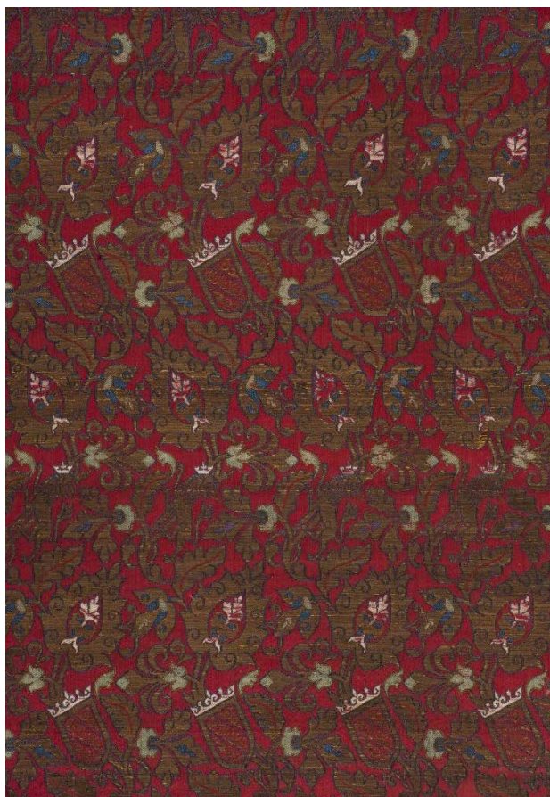
Figura 7. Fragmento de tejido con lema nazarí, siglo XIV, Museo Lázaro Galdiano, Madrid.

En el siglo XV predominan los tejidos listados con franjas de diferente anchura donde se desarrollan esquemas geométricos con predominio de motivos estrellados, lacerías, atauriques e inscripciones epigráficas. De estos tejidos hay numerosos ejemplos, algunos de grandes dimensiones conocidos como cortinas de la Alhambra porque completarían la decoración de las estancias del palacio nazarí complementando la labor minuciosa desarrollada en bóvedas o techumbres, yesería y alicatados coadyuvando a la representación de la creación y su proceso regenerador [29, pp. 223-224; 25, pp. 25-31]. Los tejidos andalusíes listados de los siglos XIV y XV se caracterizan por su rico colorido en rojo, amarillo, blanco y azul con bandas de distinta anchura decoradas con ataurique, motivos geométricos e inscripciones epigráficas donde se repite el lema de la dinastía “gloria a nuestro señor el sultán” o los términos “bendición”