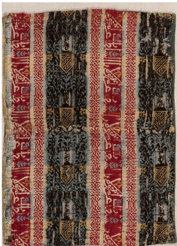
Figura 9. Fragmento del ataúd del infante D. Felipe, ca. 1274, Museo Lázaro Galdiano, Madrid.

resultado tejidos distintos, por lo que es más adecuada una clasificación cronológica, teniendo en cuenta que en técnica y decoración responde a las producciones del siglo XIII. No parece necesario introducir una clasificación de carácter dinástico entre tejidos que son similares técnica y decorativamente en función de su cronología, es más, pensamos que precisamente la cronología nos permite comprobar la continuidad de modas más allá del devenir político.