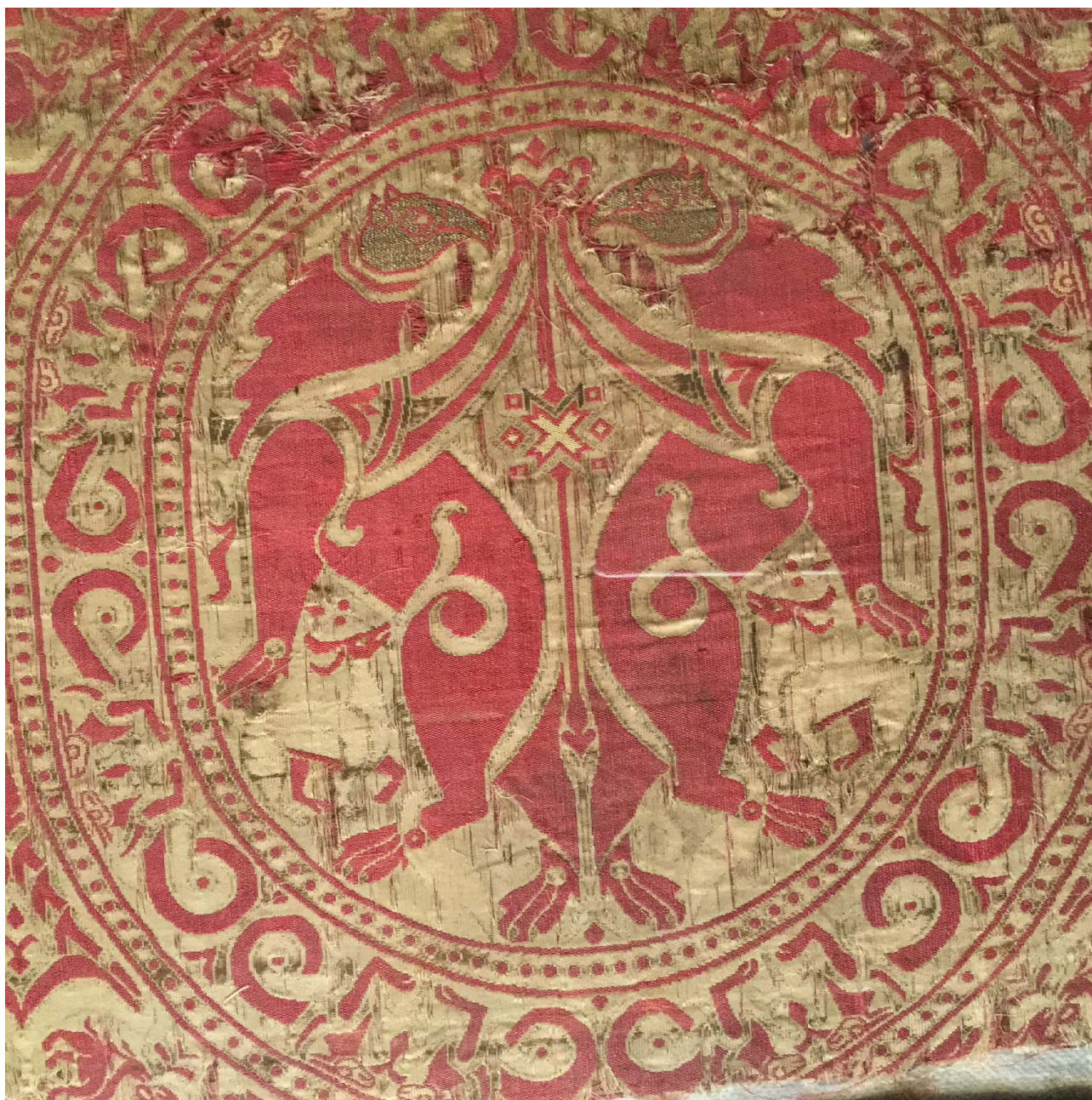
Figura 1. Tejido de Santa Librada, primera mitad del siglo XII, catedral de Sigüenza, Guadalajara.

En el estudio de los tejidos andalusíes se han relacionado estos cambios con la llegada al poder en al-Andalus de la dinastía almohade de origen bereber, considerándose la producción descrita propia de la época almorávide, teniendo en cuenta que los textiles ibéricos medievales se han clasificado acorde a las etapas históricas de la presencia del Islam en la Península: califales, taifas, almorávides,