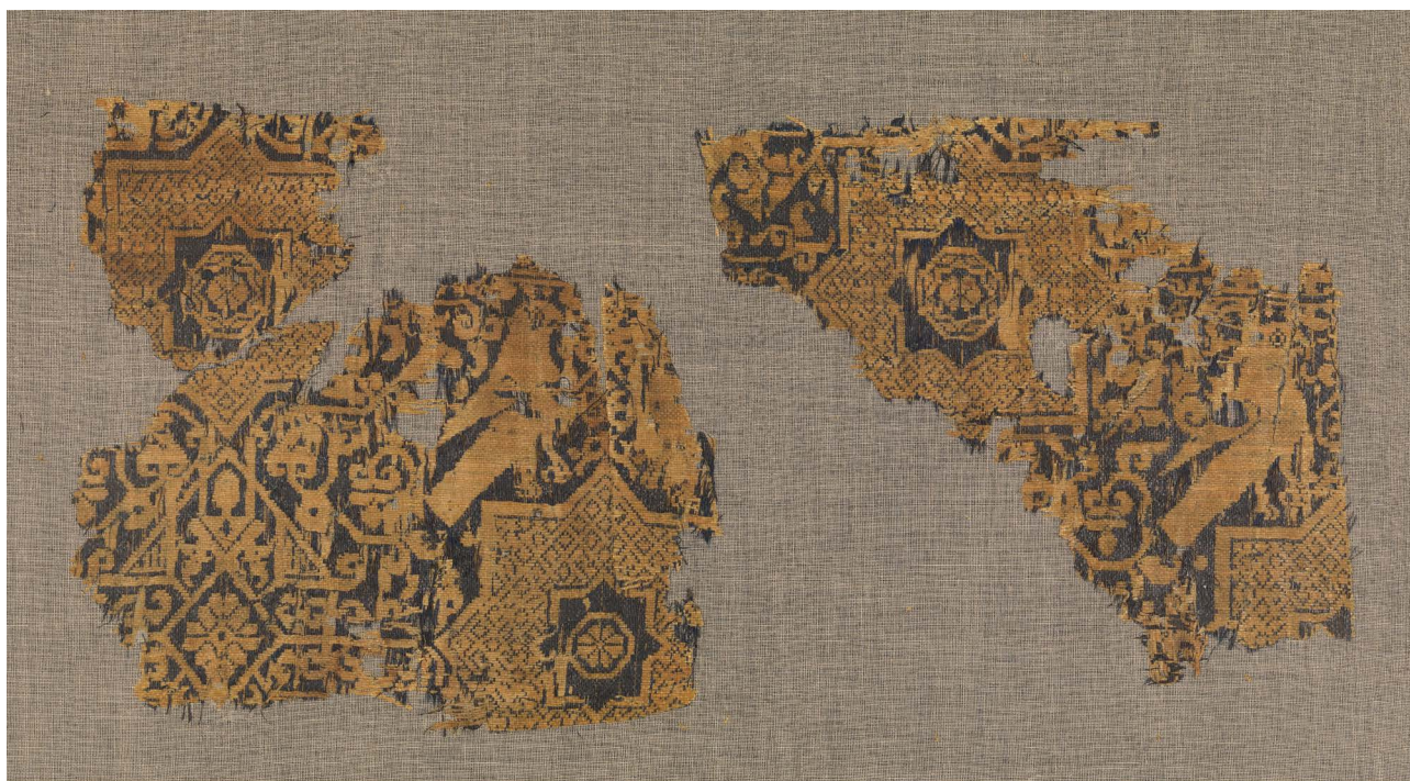
Figura 2. Fragmento de textil procedente de un manto, Irán, siglo XI-XII, Metropolitan Museum of Art, Nueva York.

almohades y nazaries [8, 11-12]. Es cierto que a partir de mediados del siglo XII los motivos y los esquemas compositivos de los textiles varían predominando composiciones en red de rombos, patrones simétricos, medallones y bandas alternas de diferente anchura que contienen motivos diversos junto a inscripciones con bendiciones y alabanzas, pero estos diseños no son exclusivos de la producción andalusí, advirtiéndose similitudes en las producciones coetáneas de otras manufacturas, aunque mantiene singularidades en técnica, cromatismo, elementos ornamentales y epigrafía, como se puede observar cuando se realizan estudios comparativos.