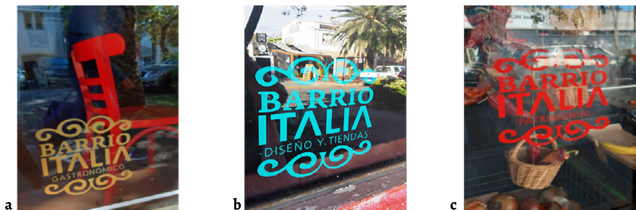
Figura 6. Uso del logo Barrio Italia (Somos Italia) en los comercios generando imagen identificativa de este barrio singular: a) color dorado: gastronomía; b) color turquesa: diseño y comercio minorista; c) color rojo: comercios patrimoniales.