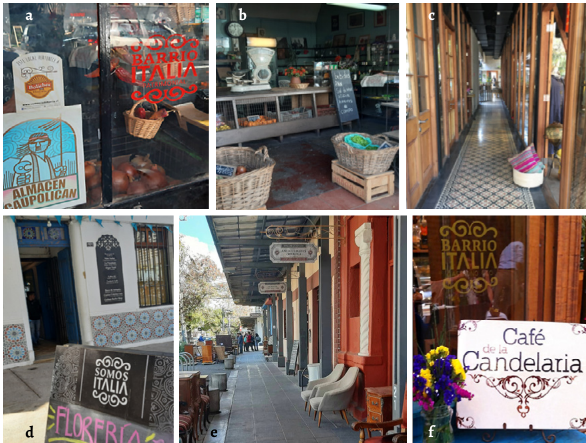
Figura 3. Ejemplos de tipología de emprendimientos peculiares que capitalizan Barrio Italia (galerías comerciales, almacenes de alimentación y pequeño comercio): a) Almacén Caupolicán: almacén tradicional, además de la asociación Somos Italia, posee el distintivo de Boliches con Historia (Guía virtual sobre comercio de barrio tradicional, en Santiago de Chile); b) Almacén Caupolicán: comercio que busca simular cómo eran los almacenes de mediados de siglo XX dedicado a las frutas y las verduras; c) Galería Maison Italia: casona que alberga emprendimientos de moda en la primera planta y un hotel boutique y restaurante en la segunda planta; d) Galería Porta Azul: Casona con diferentes emprendimientos de moda, diseño, muebles y restaurantes; e) Estación Caupolicán: calle repleta de comercios de anticuarios donde poseen tienda y talleres dichos anticuarios; f) Café Candelaria: café tradicional de Barrio Italia dentro del patio o galería Candelaria.

emprendimiento, dónde albergan a diversos emprendedores para actividades de coworking , universidades tienen su despacho de emprendimiento en aquel sitio y además existe un maker space , para que emprendedores puedan desarrollar sus prototipos. Existe además el Teatro Italia, que es el mismo que existía en la antigüedad y que actualmente se utiliza para actividades culturales y de emprendimiento.