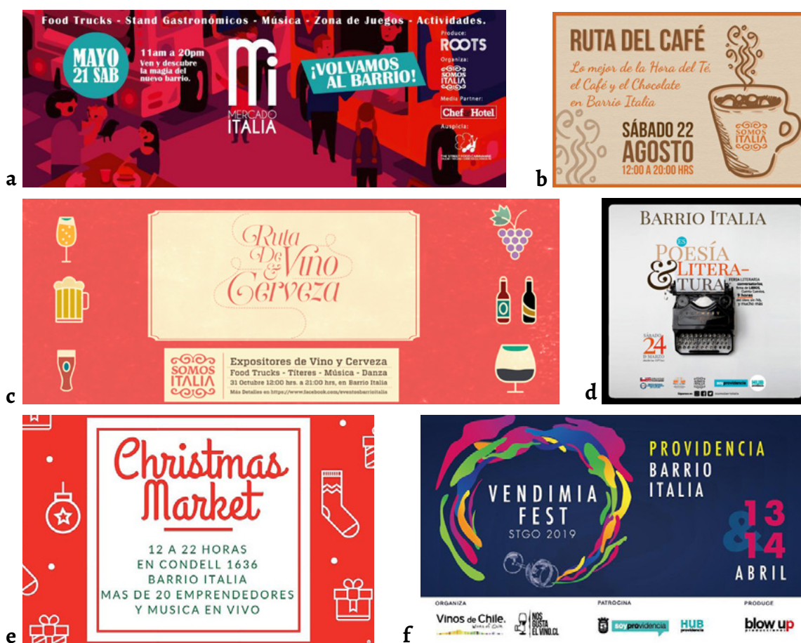
Figura 4. Actividades de dinamización del barrio organizadas por la Asociación Barrio Italia. Afiches desarrollados por la Asociación Gremial de Comerciantes Barrio Italia ( http://www.barrioitalia.com ): a) Mercado Italia (food trucks, stands gastronómicos, música, zona de juegos y actividades culturales); b) Ruta del Café (degustaciones, venta y charlas sobre café, té y chocolate, impartidas por los cafés del barrio); c) Ruta del Vino y la Cerveza (expositores de vino y cerveza del movimiento de viñateros independientes, food trucks, títeres, música y danza); d) Poesía y Literatura (es una feria literaria con cuentacuentos, firma de libros al aire libre); e) Christmas Market (Mercado navideño, dónde los pequeños comercios exponen sus productos en el barrio); f) Vendimia Fest (vendimia urbana, stands de degustación y venta de vinos en la avenida principal del barrio).

En el Barrio se encuentran además algunos otros entes organizacionales como la Asociación Gremial de Anticuarios de la Estación Caupolicán, residentes, vecinos y Junta de Vecinos n° 6 Santa Isabel, que corresponde a los vecinos del sector de calle Condell, Rancagua, Manuel Montt y Caupolicán. Las principales acciones de la Asociación son el asesoramiento y las tareas relacionadas con la promoción y publicidad del barrio. La Asociación Gremial de Comerciantes Barrio Italia promueve actividades de todo tipo ( Figura 4 ) para darle dinamismo al barrio y hacerlo más interesante.